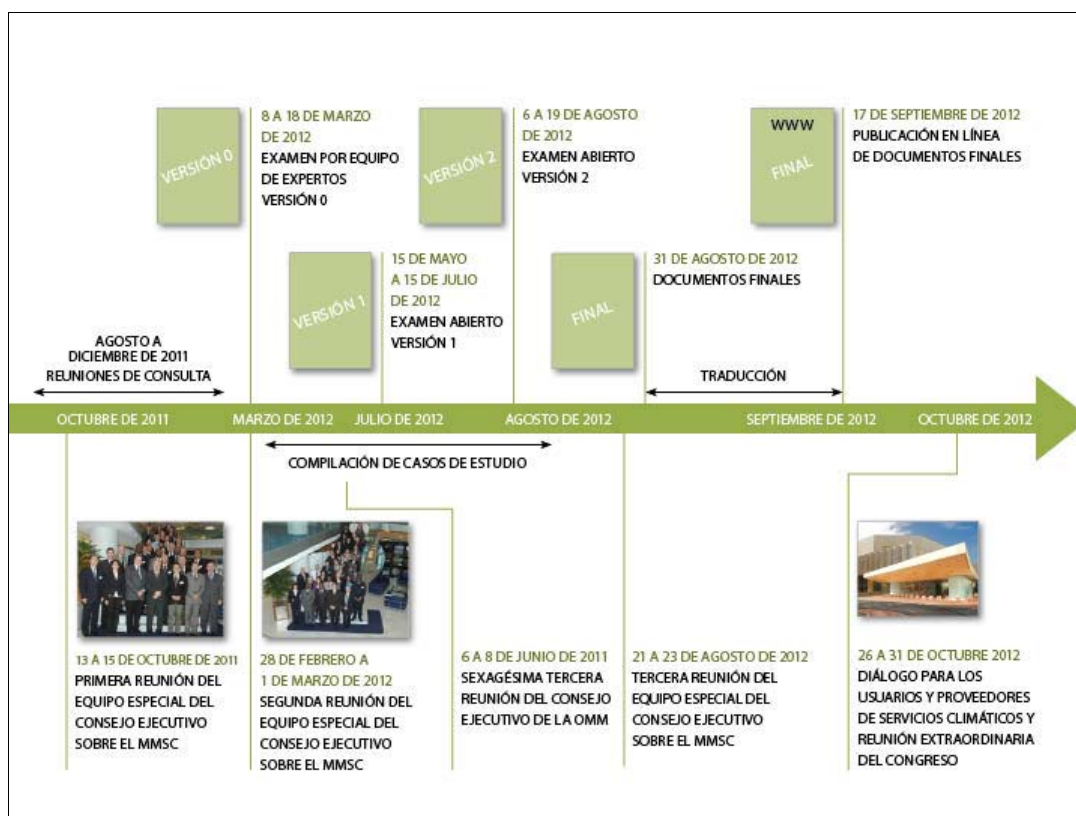
Figura 1.1: Proceso relativo a la presentación del Plan de ejecución ante el Congreso Meteorológico Mundial en su reunión extraordinaria de octubre de 2012.

El Marco no consiste en una nueva entidad encargada de prestar servicios climáticos. Se trata de un mecanismo habilitador cuya utilidad reside en coordinar, facilitar y desarrollar servicios climáticos con fines operativos allí donde sea necesario. El Marco permite salvar la brecha entre los usuarios y los proveedores de servicios, velando por que las inversiones e iniciativas pasadas y futuras se aprovechen plenamente. En un principio, el Marco se centrará en ofrecer mayores beneficios en cuatro esferas prioritarias: la reducción de riesgos de desastre, el incremento de la seguridad alimentaria, la mejora de las condiciones sanitarias y el fomento de una gestión eficaz del agua. Estas esferas constituyen el centro de atención debido a que ofrecen la posibilidad más inmediata de beneficiar a los procesos de adopción de decisiones a todos los niveles y tienen efectos en la seguridad y el bienestar humanos. A medida que la ejecución del Marco vaya progresando, será posible determinar y perseguir beneficios en otros sectores tales como la energía y el transporte.