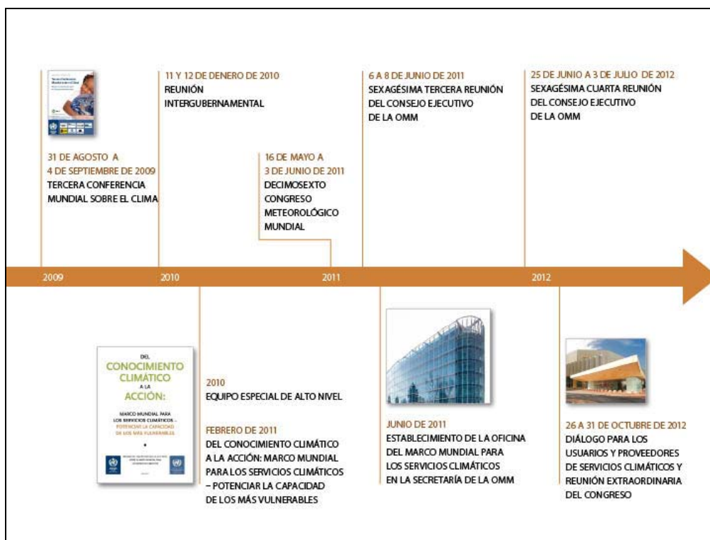
Figura 1.2: Evolución histórica del Marco Mundial para los Servicios Climáticos

En el presente Plan se ofrece un resumen y una lista de actividades por orden de prioridad que ha propuesto la comunidad internacional en el último año. Su realización fue posible mediante un proceso inclusivo de reuniones consultivas llevadas a cabo en todos los componentes funcionales del Marco, con la participación de más de 300 expertos mundiales y la recopilación de estudios de caso de más de 60 países ( http://www.wmo.int/pages/gfcs/consultations_es.php ). Estos conocimientos colectivos se sintetizaron en cinco anexos, uno por cada uno de los componentes funcionales (“pilares”), además de cuatro Ejemplares, uno por cada esfera prioritaria. En los anexos se exponen las necesidades que es preciso satisfacer en el contexto mundial actual para alcanzar las metas establecidas en el Marco y se especifican las actividades prioritarias que permitirán lograrlo. Los Ejemplares ofrecieron a los organismos principales de las esferas prioritarias la posibilidad de formar sus opiniones sobre los elementos necesarios para cumplir con las promesas del Marco.